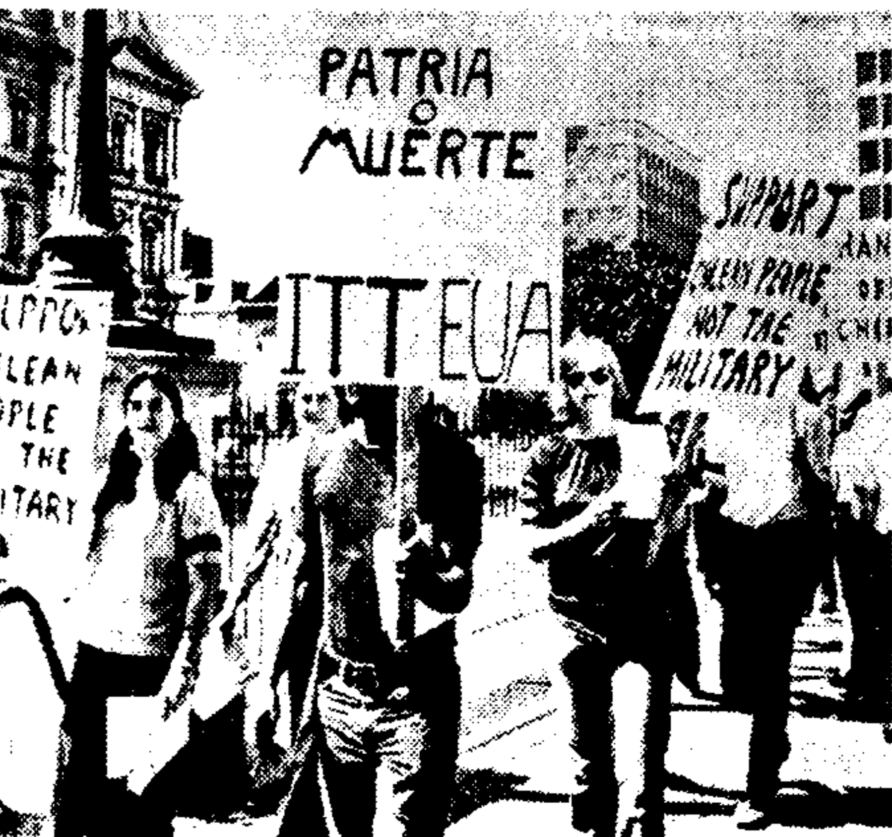
Δημόφιλοι στην Ουάσιγκτον, κοντά στο Λευκό Οίκο, με χαρακτηριστικές επιγραφές εναντίον των άνταρκοτύπων του προέδρου Άλλέντε.

ΚΑΙ ΕΝΑΣ 46ΕΤΗΣ ΠΑΤΡΑ, 13. Τού άνταρκοτύπου μας, Σκοτώθηκε χές από κεραύνο στο χωριό Σταυροπόρτι.